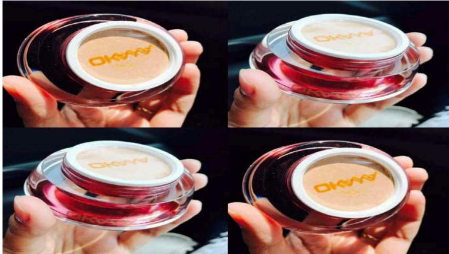
Caption : FD Okaya